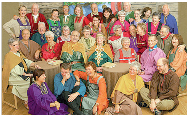
Vikingakören uppträder på Nossebro Scen.

Ansökan om tider i fritidsanläggningarna senast 18 augusti. Mer info www.essunga.se